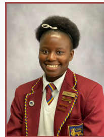
Onderhoofdogter Akademie Need Munene